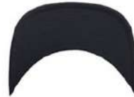
DARK NAVY/ DARK NAVY