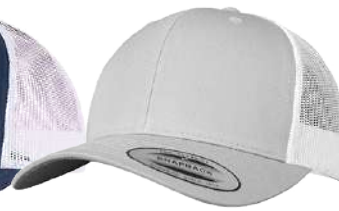
SILVER / WHITE