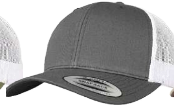
DARK GREY / WHITE