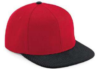
CLASSIC RED/ BLACK