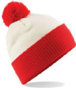
OFF WHITE/BRIGHT RED