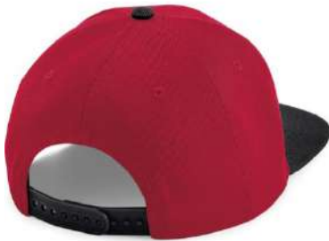
Nastavitelný plastový pásek/ Adjustable plastic strap