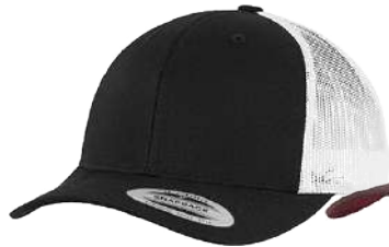
BLACK / WHITE