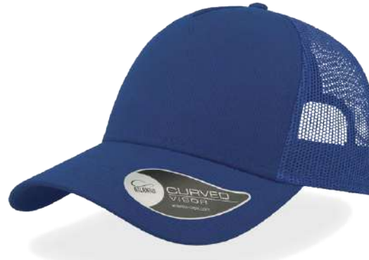
ROYAL / ROYAL