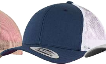
NAVY / WHITE