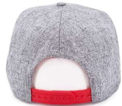
MELANGE GREY/ BLACK