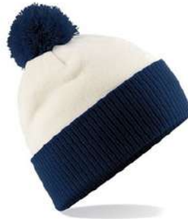
OFF WHITE/FRENCH NAVY