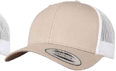
BEIGE / WHITE