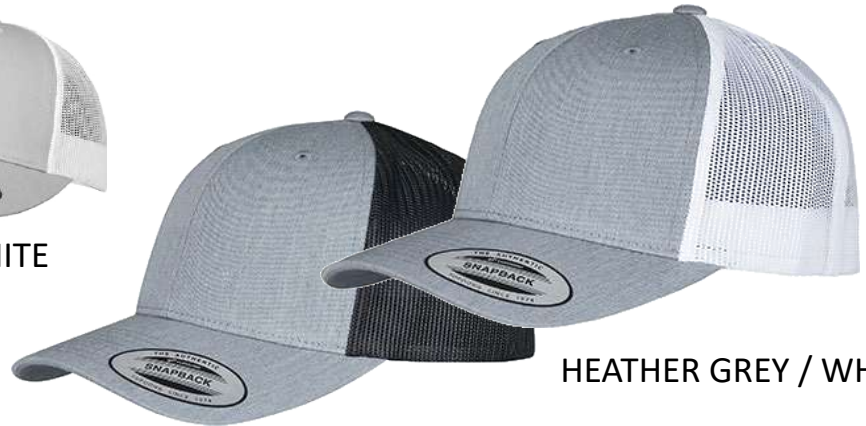
HEATHER GREY / BLACK

Nastavitelný plastový pásek/ Adjustable plastic strap