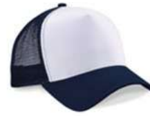
FRANCH NAVY/ WHITE