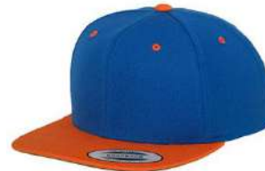
ROYAL BLUE / ORANGE