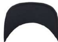
DARK NAVY/ DARK NAVY