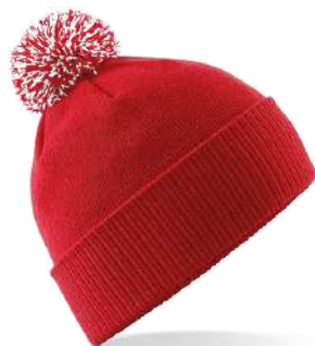
CLASSIC RED/ WHITE