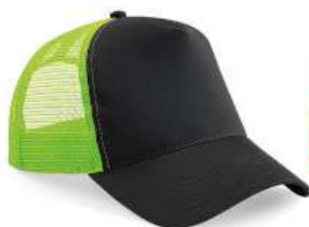
BLACK/ LIME GREEN