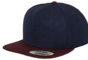
NAVY / MAROON