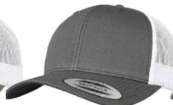
DARK GREY / WHITE