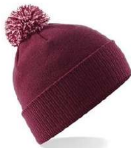
BURGUNDY/ OFF WHITE