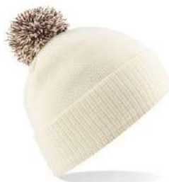
OFF WHITE/ MOCHA