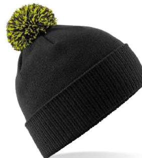
BLACK /LIME GREEN