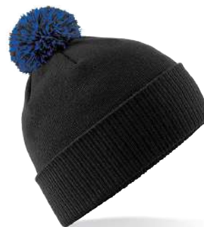
BLACK /BRIGHT ROYAL