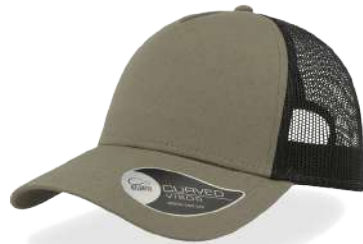
OLIVE / BLACK