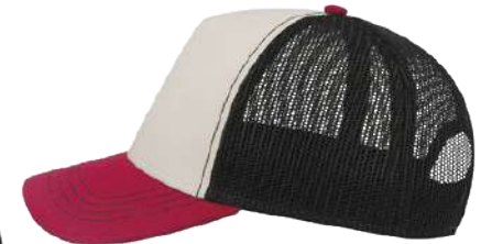
Nastavitelný plastový pásek / Adjustable plastic strap