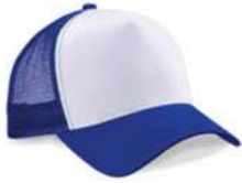
BRIGHT ROYAL/ WHITE