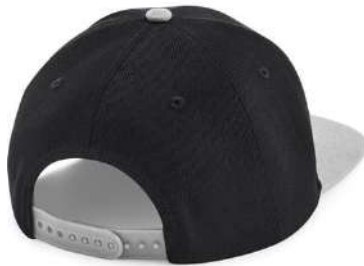
Nastavitelný plastový pásek/ Adjustable plastic strap