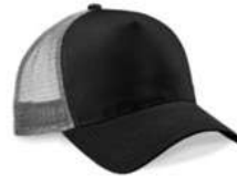
BLACK/ LIGHT GREY