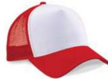
CLASIC RED/ WHITE