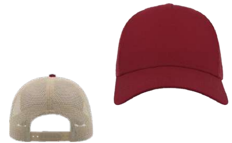
Nastavitelný plastový pásek / Adjustable plastic strap