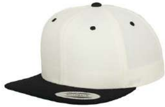
NATURAL / BLACK