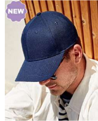
Nastavitelný plastový pásek / Adjustable plastic strap