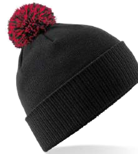
BLACK / CLASSIC RED