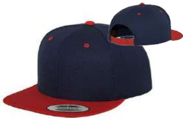
NAVY / RED