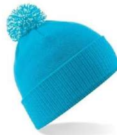
SURF BLUE/ OFF WHITE