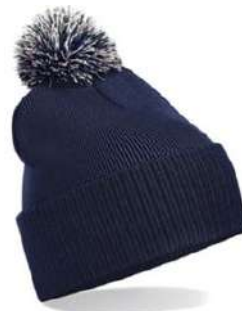
FRANCH NAVY/ LIGHT GREY