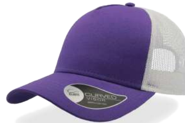
PURPLE / WHITE