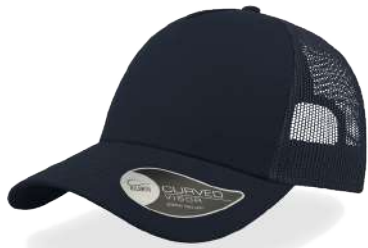
NAVY / NAVY