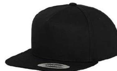
BLACK / BLACK