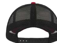
Nastavitelný plastový pásek/ Adjustable plastic strap