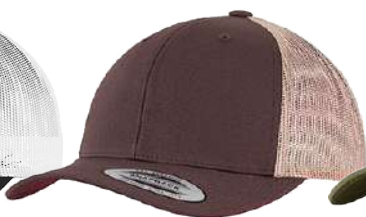
BROWN / KHAKI