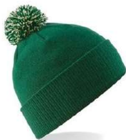
BOTTLE GREEN/ OFF WHITE