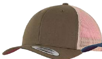
MOSGREEN / BEIGE