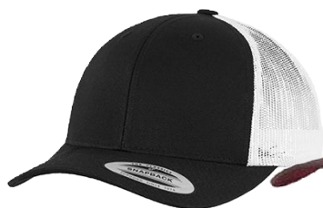
BLACK / WHITE