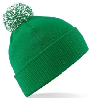
KELLY GREEN/ WHITE