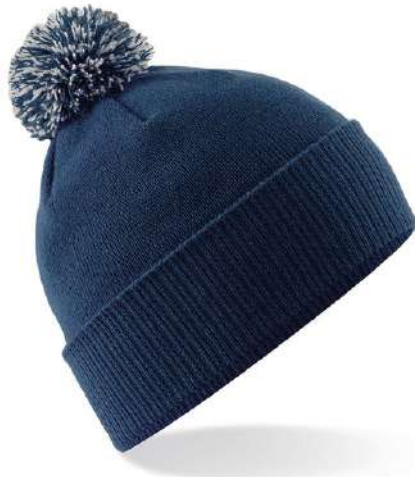
NAVY BLUE/LIGHT GREY