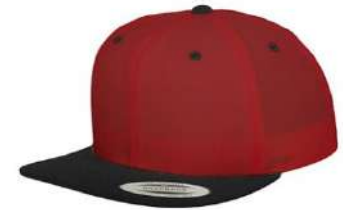
RED / BLACK