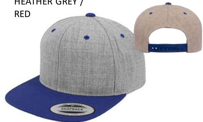
HEATHER GREY / ROYAL