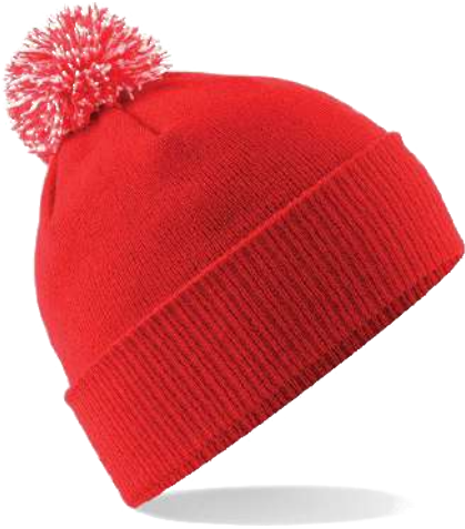
BRIGHT RED/ OFF WHITE