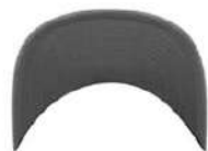
DARK GREY/ DARK GREY