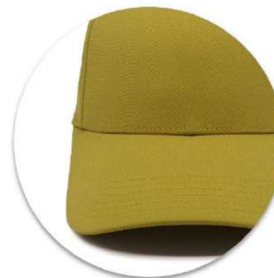
Kšiltovka má 6 panelů, ale přední šev je skrytý / 6 panel hat with hidden front seam