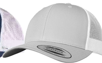
SILVER / WHITE