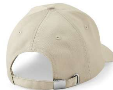
Kovové zapínání /Metal fastening