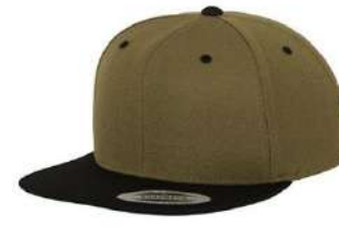
OLIVE / BLACK