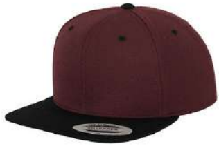
MAROON / BLACK