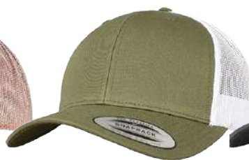
OLIVE / WHITE