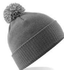
GRAPHITE GREY/ LIGHT GREY