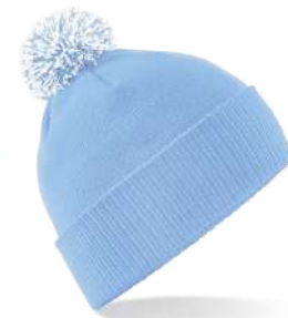
SKY BLUE/ WHITE