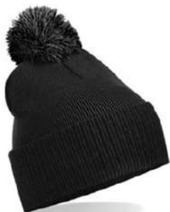
BLACK /GRAPHITE GREY