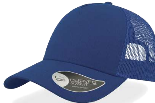
ROYAL / ROYAL