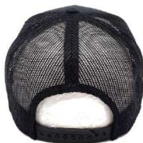
Nastavitelný plastový pásek/ Adjustable plastic strap