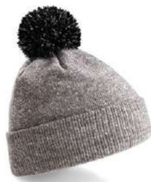
HEATHER GREY/ BLACK