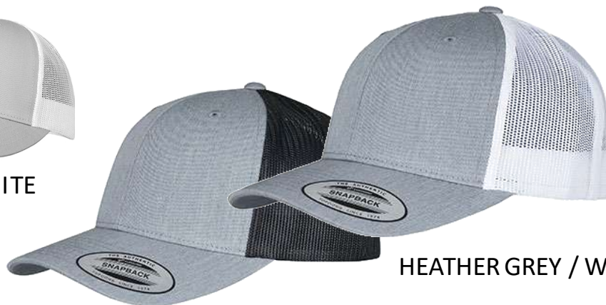
HEATHER GREY / BLACK

Nastavitelný plastový pásek/ Adjustable plastic strap