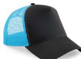
BLACK/ SURF BLUE