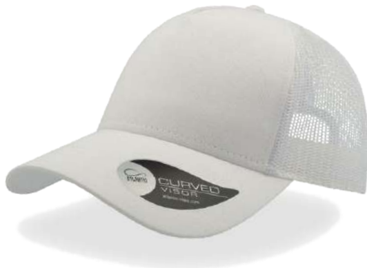
WHITE / WHITE