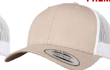
BEIGE / WHITE