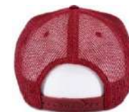
Nastavitelný plastový pásek/ Adjustable plastic strap