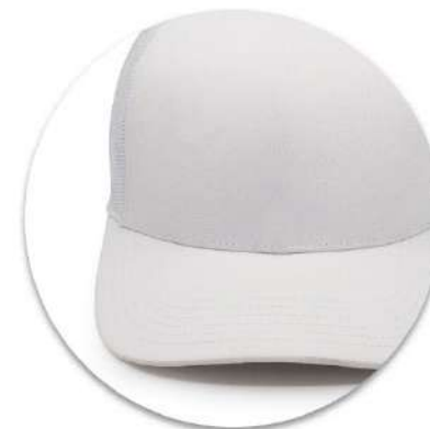
Kšiltovka má 6 panelů, ale přední šev je skrytý / 6 panel hat with hidden front seam