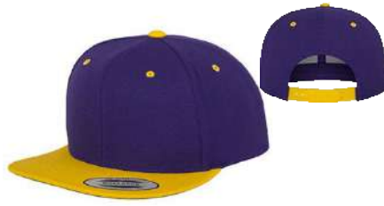
PURPLE / GOLD