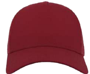
Nastavitelný plastový pásek/Adjustable plastic strap