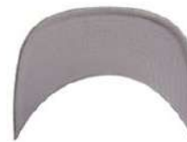
HEATHER GREY/ HEATHER GREY