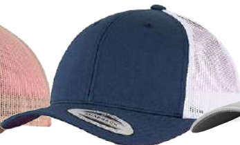
NAVY / WHITE