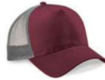
BURGUNDY/ LIGHT GREY