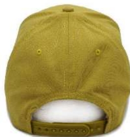
Nastavitelný plastový pásek/ Adjustable plastic strap